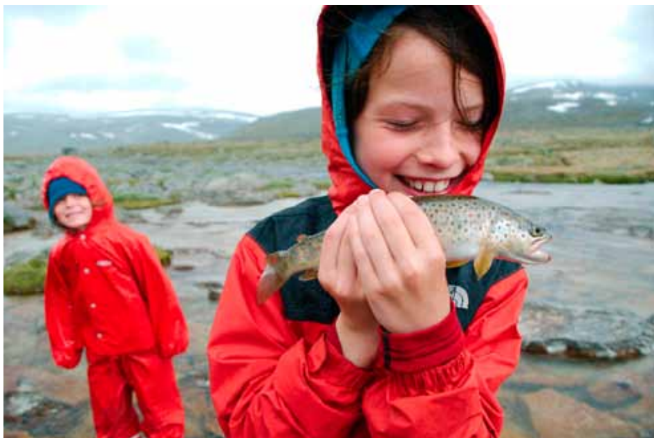
Den første fjellørreten.

vokste lyngen, lar fjellet fylle oss fullt og helt. Himmelen står i brann bak Snøhetta, og vinden legger seg. Siden glir landskapet over i blått og lilla. Bare fjelltoppene lyser svakt opp i rosa. Det går mot en stille natt i hjertet av Dovrefjell.